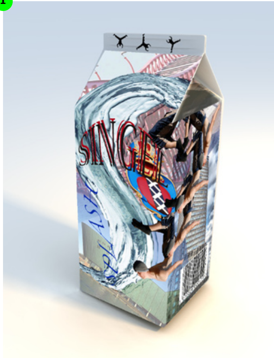
Marcel 1 3D presentatie

beoordeling: creatieve invulling presentatie techniek